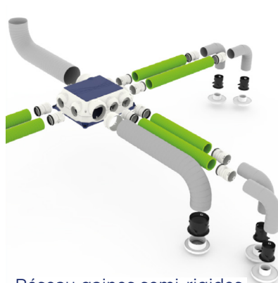
Réseau gaines semi-rigides